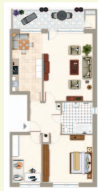
Exposéaufbereitung: vorher und nachher

behindern können? Gibt es hinsichtlich einer Eigentumswohnung Probleme mit der Eigentümergemeinschaft oder Kostenfallen durch vorgesehene Investitionen. Wie ist der tatsächliche Energieverbrauch? Ist ein Grundstück tatsächlich so bebaubar, wie es scheint?